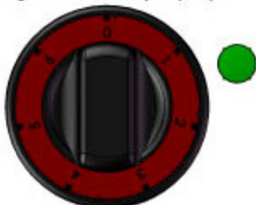
Regulační knoflík plotýnky