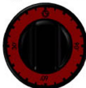
Regulační knoflík časovače